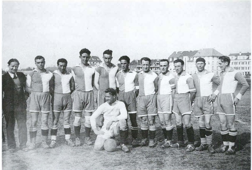
1. Mannschaft, Saison 1932/33