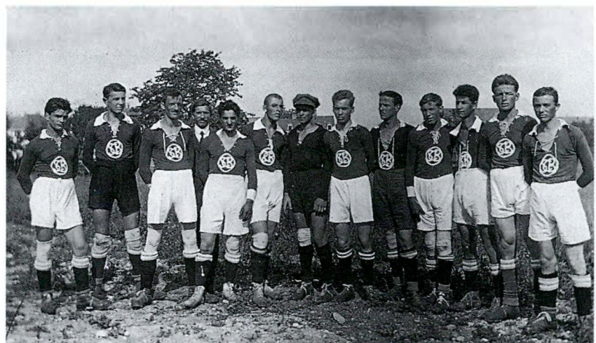
1. Mannschaft, Saison 1923/24