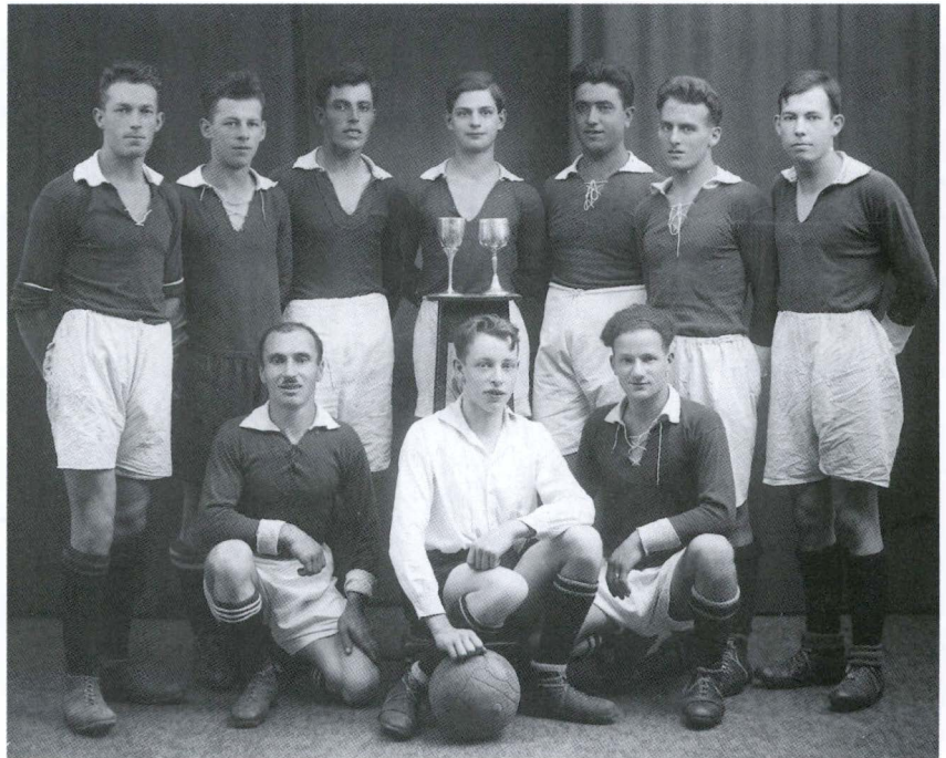
1. Mannschaft, Saison 1926/27

Die Meisterschaft bestritten zwei Aktivmannschaften und die «Dritte» galt als Senioren-Team. Der 1. Mannschaft war guter Erfolg beschieden, gewann sie doch alle Meisterschaftsspiele bis auf eines in Muttenz und wurde Gruppenzweite. Sie hielten sich schadlos, indem die Turniere in Lenzburg und Münchenstein gewonnen wurden. Die 2. Mannschaft errang den 3. Gruppenplatz. Die Senioren holten sich Turnierpreise in Zo-