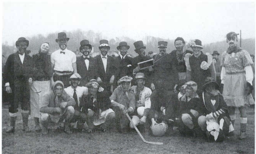
1. Faschnachtsmatch auf der Ziegelei

Am 27. August 1939, anlässlich der Kriegsmobilmachung, übergab