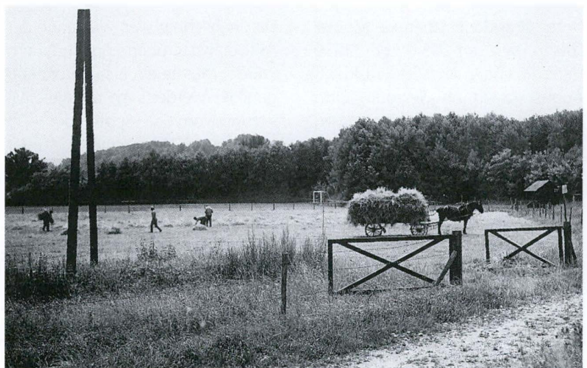
Anbauschlacht auf dem Sportplatz Ziegelei