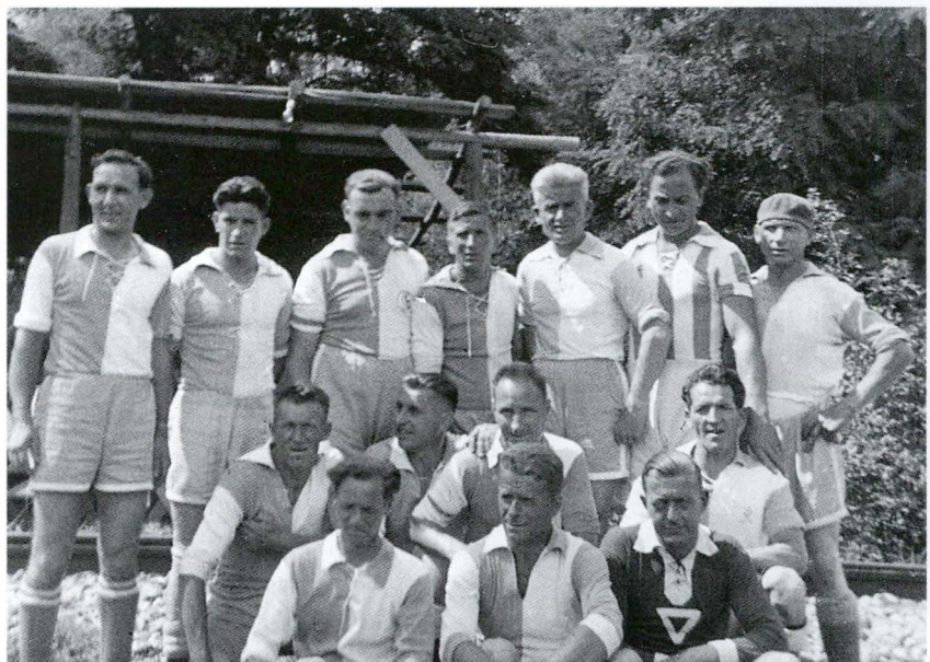
2. Mannschaft Saison 1933/34