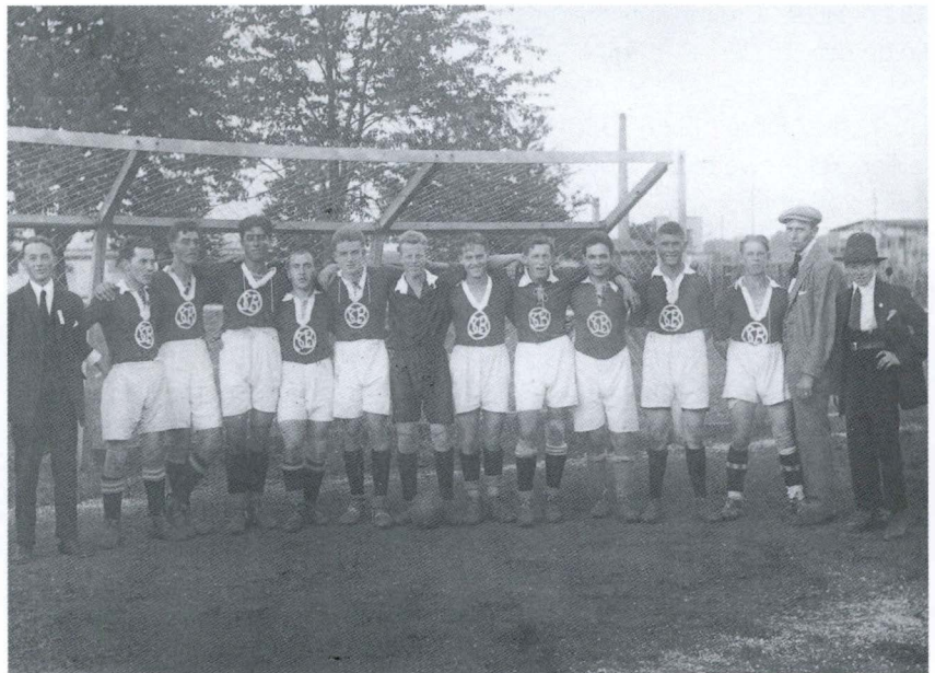
1. Mannschaft, Saison 1928/29