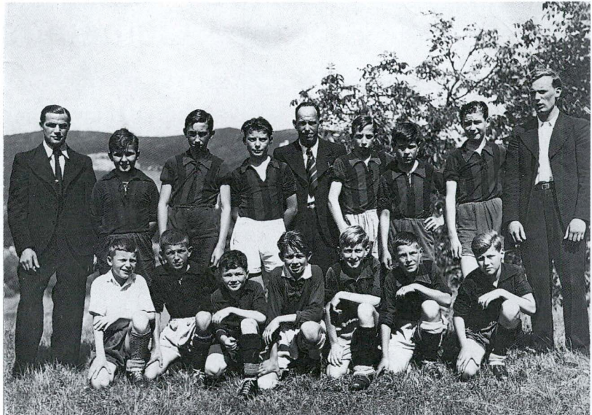
Schüler, Saison 1937/38

Damit der Verein künftig keine Festhütte für das Turnier mit Sommernachtsfest mieten musste,