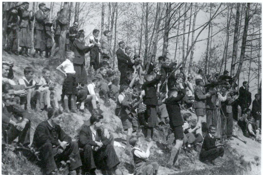
Begeisterte Zuschauer auf der Naturtribüne «Ziegelei»