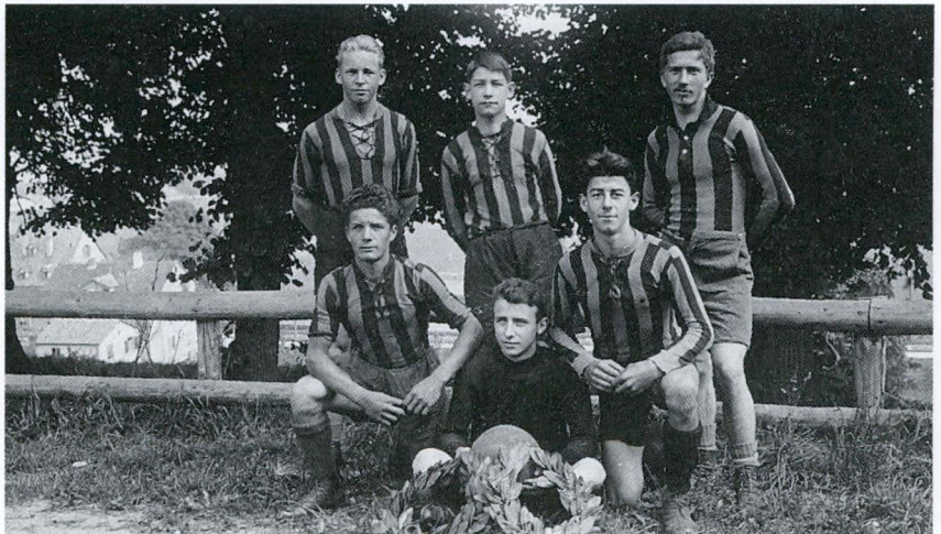
Saison 1920/21, 6er-Turnier