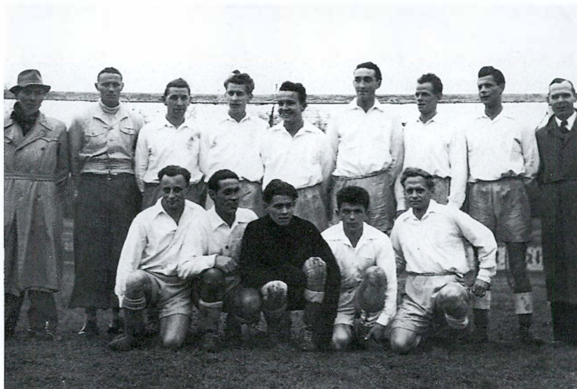
1. Mannschaft, Saison 1943/44

Der Mitgliederbestand am 22. Mai 1943 hatte sich leicht auf total 179