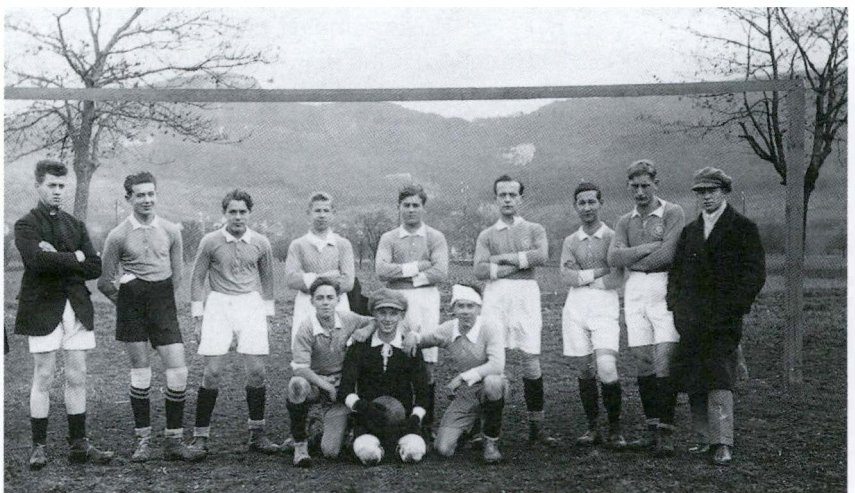
3. Mannschaft, Saison 1922/23