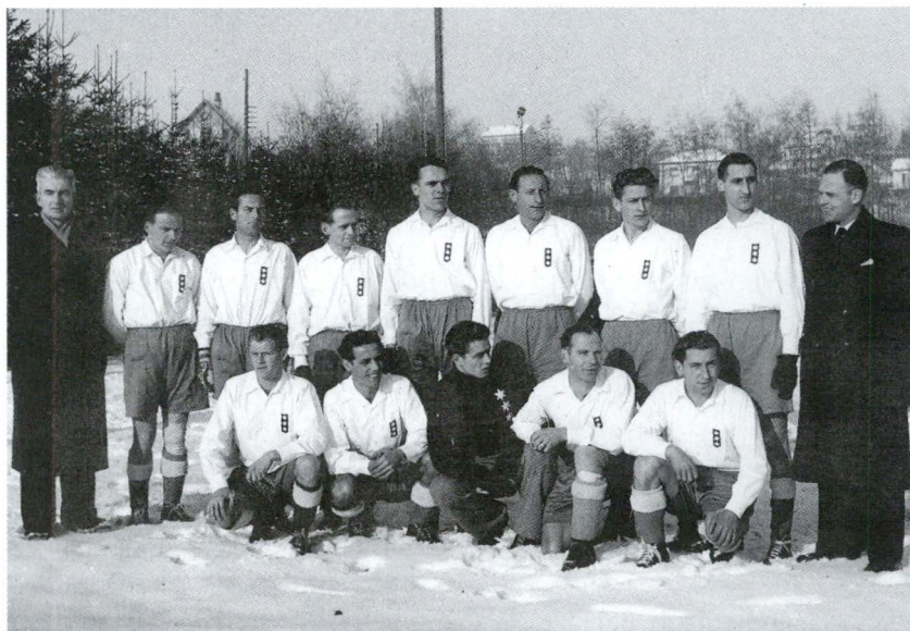
1. Mannschaft, Saison 1946/47