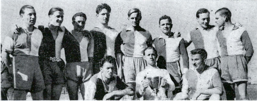
Der Gewinner des Baselbieter-Cup: F. C. Binningen