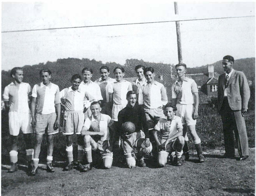
Junioren, Saison 1937/38