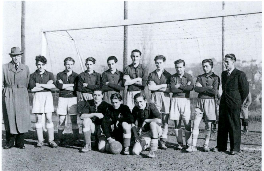
Junioren, Saison 1943/44