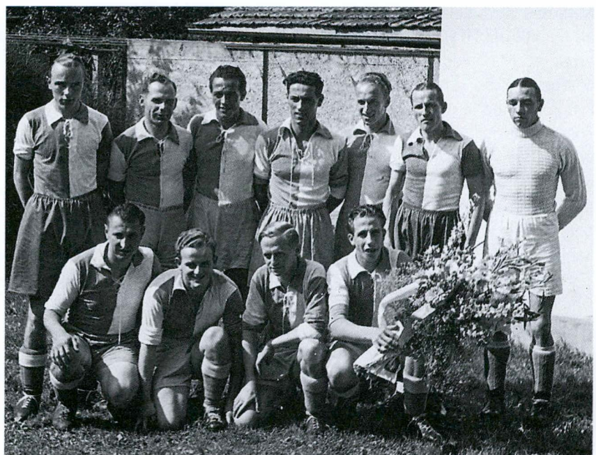
1. Mannschaft, Saison 1942/43

Artikel im Binninger Anzeigenblatt vom 11. November 1942