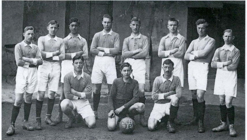
2. Mannschaft, Saison 1920/21